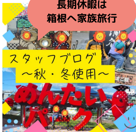
スタッフブログ ～秋・冬使用～