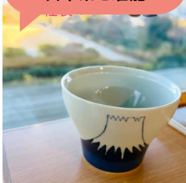
日本平夢テラスで 日本茶を堪能