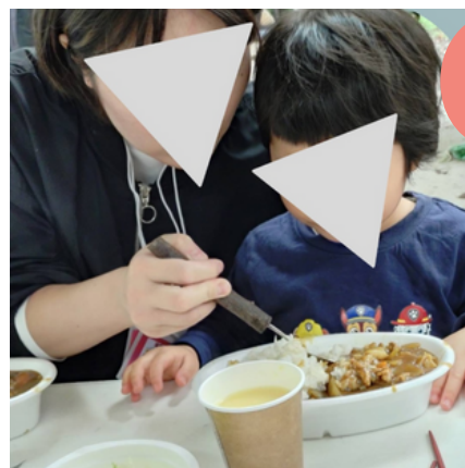
土日は子どもと デイキャンプ